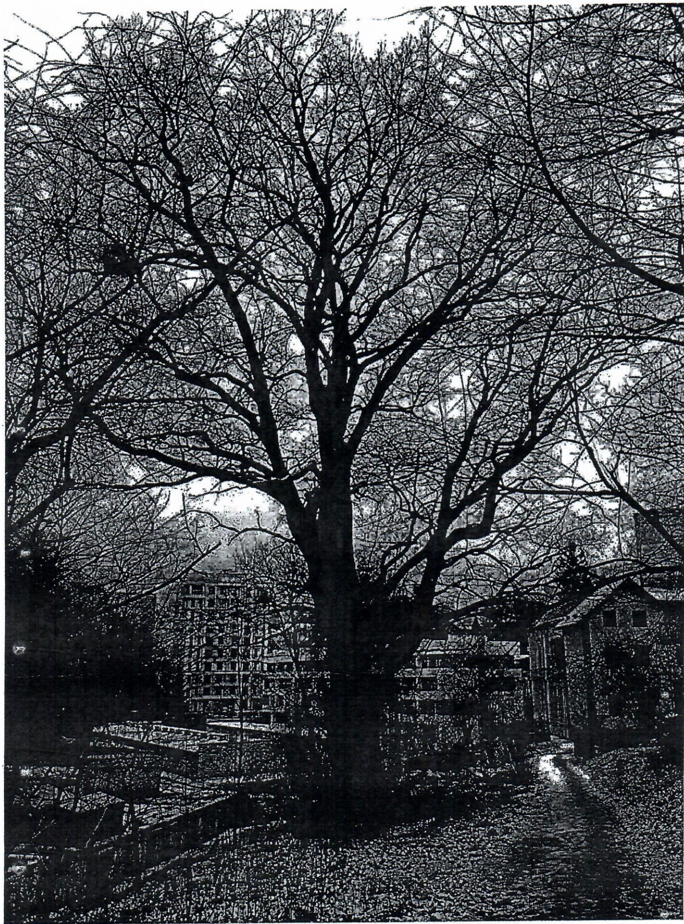
Дуб звичайний на вул. Івана Франка, 157-А- вул. Енергетична, 19